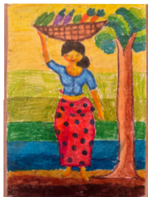
In ihren Bildern verarbeiten Kinder die Schrecken des Zyklon und zeigen den Wunsch nach Normalität