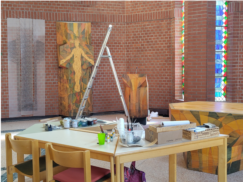
Der Franziskusraum wurde zum Atelier

cke eine Darstellung all des Schwere, was uns Menschen an den Boden bindet – der auferstandene Christus aber hat sich davon gelöst, so als würde er „mit den Flügeln schlagen“.